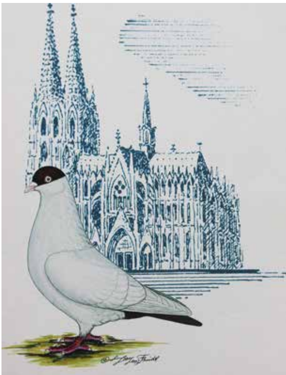
De ideale Keulse Tuimelaar voor de dom van Keulen.

De hoofdkleur blijft wit, zonder meer uitermate geliefd en wijd verspreid. Ook bij de jeugd zie je ze vaak op het hok, want witte Keulse tuimelaars zijn mak, wat voor jeugdige duivenliefhebbers ideaal is. Het is natuurlijk ook een voordeel als bij de fok niet op de kleur moet worden gelet. De witten waren altijd al krachtig van lichaam, mooie strakke duiven, die niet slechts wit zijn, maar ook een zachte glans in het gevederte moeten tonen. De koppen zijn fraai gewelfd met de stompe hoek van de krachtige snavel tot het voorhoofd. De parelogen en de smalle oogranden zijn voorbeeldig te noemen, zodat de geringste afwijking ervan bij de beoordeling al gauw tot een paar punten minder leidt. Natuurlijk valt er ook in een hoofdkleur altijd wel iets te verbeteren. De