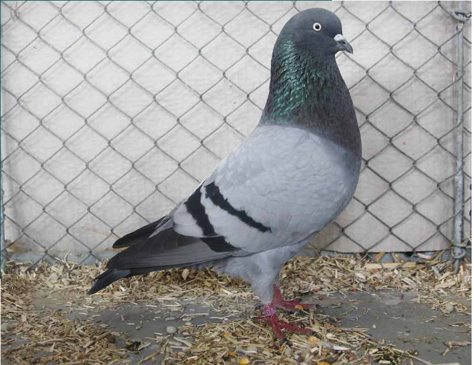
Een fraaie Keulse tuimelaar in velerlei opzicht. Hier kloppen type, kopvorm, kleur en tekening.