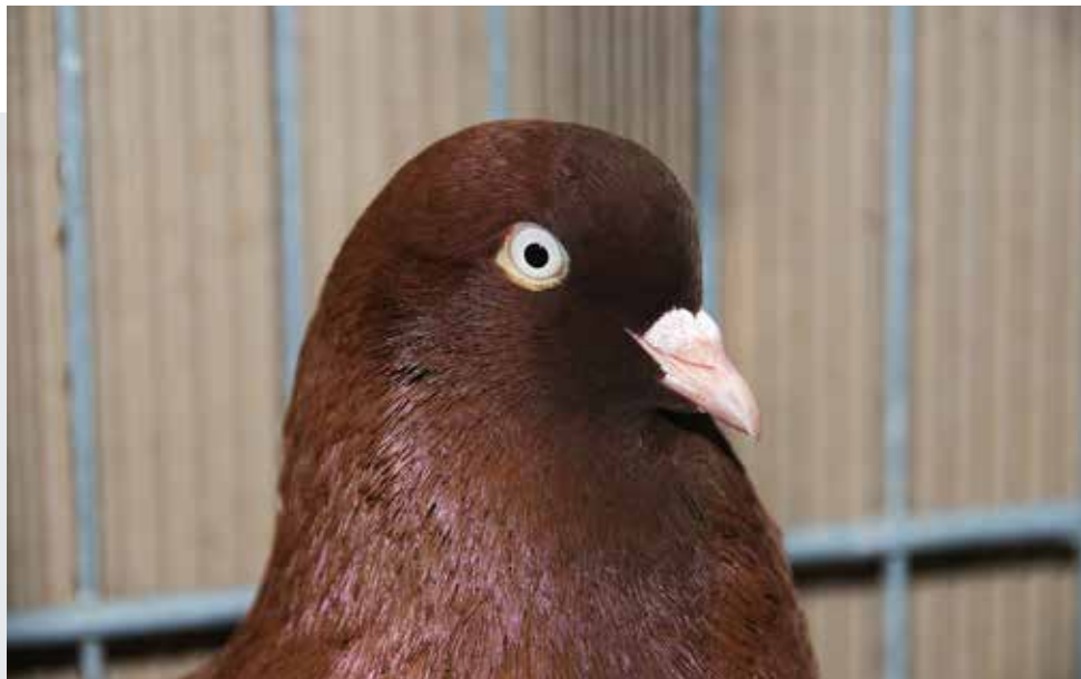
Kopstudie met een prachtig pareloog, goede oogranden en snavel.