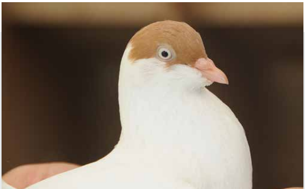
Keulse Tuimelaar geel gehelmd. De koptekening verloopt al onder het oog, wat niet altijd eenvoudig is te corrigeren.

Het is door het grote aantal van geshowde Keulse tuimelaars logisch dat de eisen hoog zijn. Eigenlijk moet alles kloppen wil je een hogere ZG of nog hoger scoren.