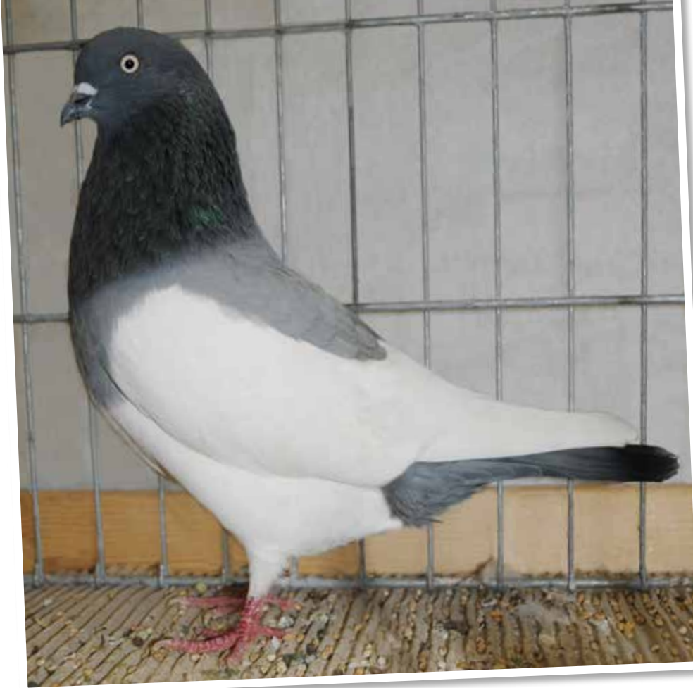
De afgelopen jaren zijn de eksters steeds beter geworden, vooral in de blauwe kleurslag. Deze duif kan duidelijker afvallen in het type.

al zo. Jonge kleurslagen zijn ook lichtgrijs gezoomd (2001) en indigo geband en indigo gekrast. De andalusisch blauwen staan nog wat hoog en zijn nog niet geheel zuiver van pareloog (invloed Duitse Modena). Als nieuwe kleur waren in 2017 blauwzilver schimmels tentoongesteld; ze werden in 2019 erkend (ook in Nederland). Algemeen geldt dat aan alle kleuren hoge eisen worden gesteld. Intensieve kleuren zonder vreemde smetten zijn karakteristiek voor het ras en