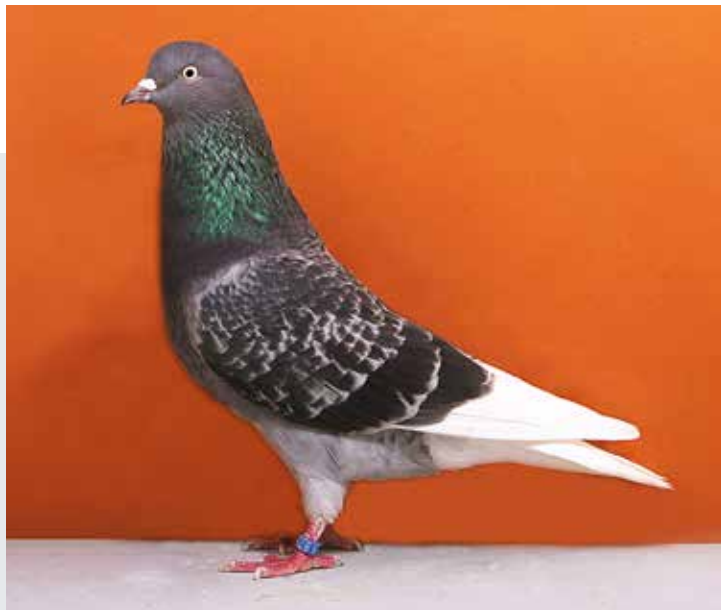
Keulse tuimelaar kras witpen witstaart van Andreas Eckstein (Duitse bondsshow 2019).