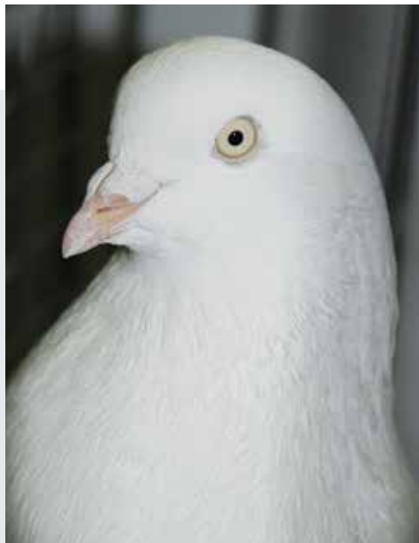
Kopstudie in de hoofdkleur wit. De overgang van de snavel naar het voorhoofd is goed te zien.

Er zijn niet minder dan 105 kleur- en tekeningvarianties, die hier niet allemaal besproken kunnen worden. De meesten ervan, de éénkleurigen, de rozetgetijgerden, witpenen, witstaarten en witpen witstaarten, zijn er zowel gladbenig als voetbevederd, wat niet inhoudt dat ze ook allen even goed zijn verspreid. Het merendeel ervan is gladbenig. De jonge kleurslag als andalusisch blauw is er slechts éénkleurig en als witpenvariëteit. De geëksterden en de helmgetekenden worden alleen gladbenig gefokt, dat was altijd